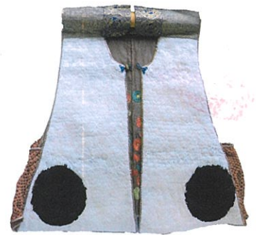
鶴毛陣羽織(素玄寺蔵)