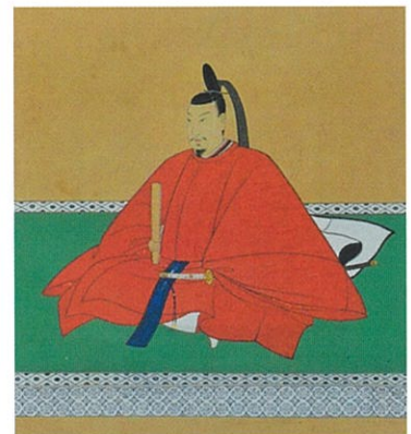
織田信長肖像(東等寺冬任文庫蔵)