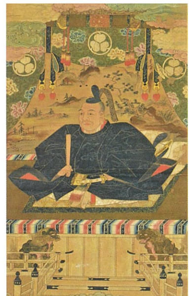
徳川家康肖像(東等寺冬任文庫蔵)