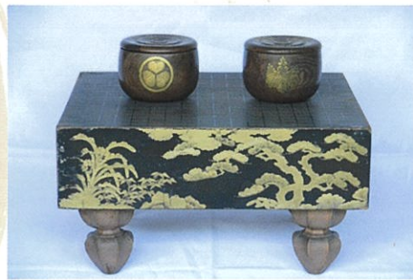
四季草木蒔絵碁盤(龍源院蔵)