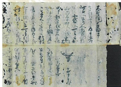
金森長近書状(当館蔵)

天文10年(1541)18歳の時に信長の養育係となり、以後、信長に仕えて数々の戦いに身を投じた長近。信長仕官時代の長近を辿ります。