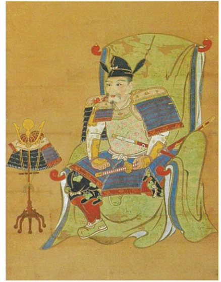
豊臣秀吉肖像(東等寺冬任文庫蔵)