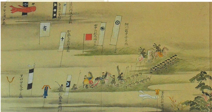
関ヶ原合戦絵巻(東等寺冬任文庫蔵)

京都伏見の屋敷に滞在し、文化的な交流を深めた晩年の長近。また、関ヶ原の戦いに参陣するなど、老齢でありながら戦場にも立ち続けました。そうした長近の晩年の様子を紹介します。